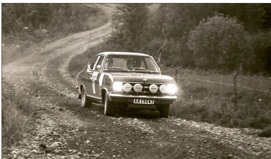
SM-Rallyt Värmland runt 1970 med en Opel Rally Kadett