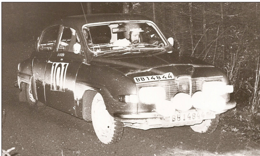
Göran kör och jag är kartläsare vid ett minirally i början av 70-talet med en SAAB 96 V4

Från 1970 blev det också minirallyn ihop med Göran. Det var en intensiv period med orienteringstävlingar på onsdagskvällarna och minirallyn på helgerna. Vi körde 60–80 tävlingar tillsammans.