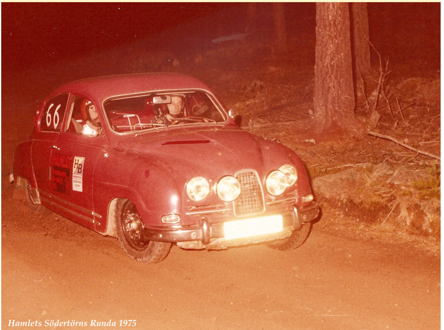
Hamlets Södertörns Runda 1975