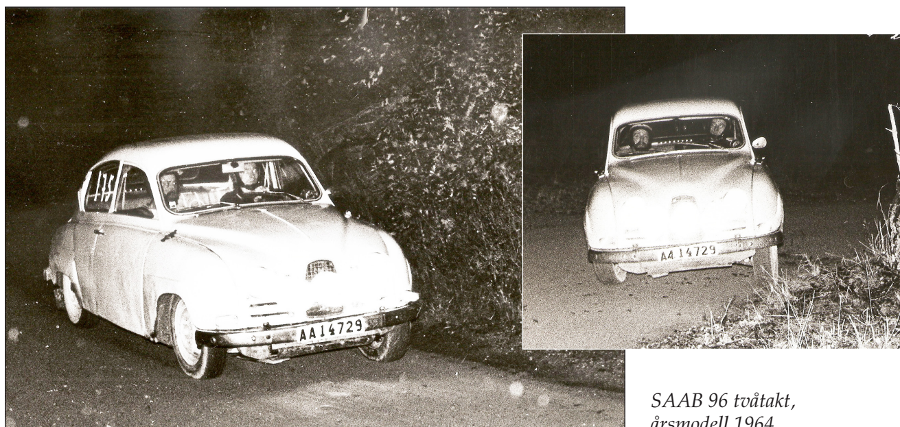
SAAB 96 tvåtakt, årsmodell 1964

Bilen fick senare en standardmotor och fick tjänstgöra som familjebil och från den tiden kommer jag ihåg några händelser.