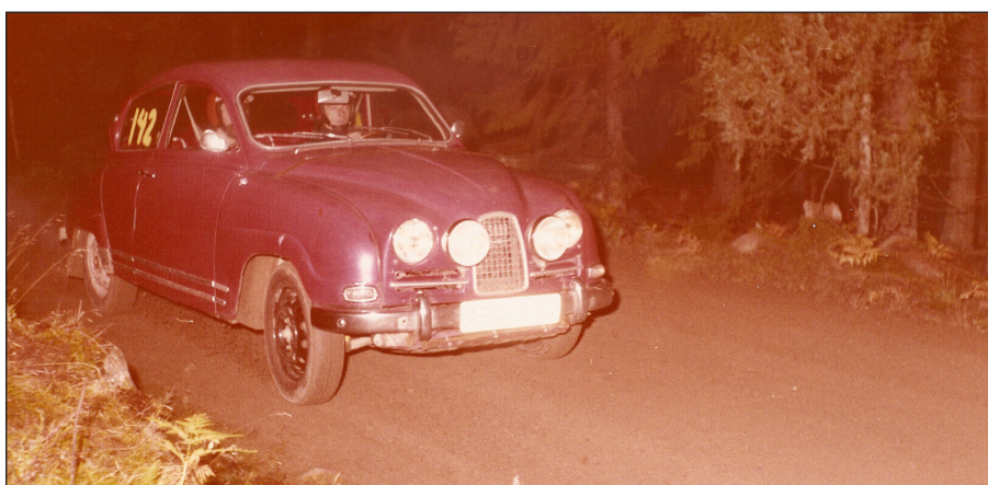
SAAB 96 Sport tvåtakt, årsmodell 1963

Svärfar Svenne och jag for dit och blev visad en grön SAAB Sport som stod som tredjebil högst upp. En gaffeltruck kom fram och körde gafflarna rakt igenom bilen och släppte ner den på backen, pang. En sådan bil kostar säkert 100 000 kr idag.