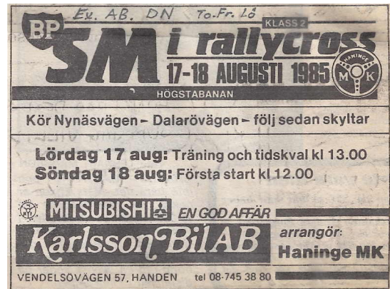
SM i Rallycross 17-18 augusti 1985.